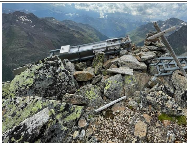
Reste des Gipfelkreuzes, Teil 1

Bereits seit einigen Jahren begegnet dem Vorstand immer mal wieder das Thema dieses schon seit einigen Jahren umgestürzten Gipfelkreuzes. Unter anderem im Rahmen früherer Mitgliederversammlungen wie der im Jahr 2024 wurde vom Vorstand der Sektion zugesagt, dass die Teile dieses Gipfelkreuzes vom Gaiskogl (sh. Fotos und Planausschnitt) entfernt werden sollen. Diese Aufgabe soll im Sommer 2026 erledigt werden. Entsprechende Vorbereitungen und Absprachen sind vom Vorstand veranlasst.