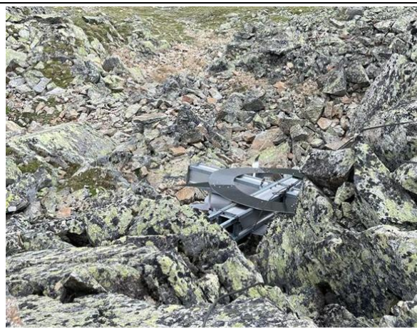
Reste des Gipfelkreuzes, Teil 2